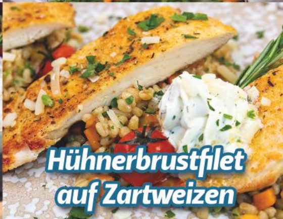
Hühnerbrustfilet auf Zartweizen